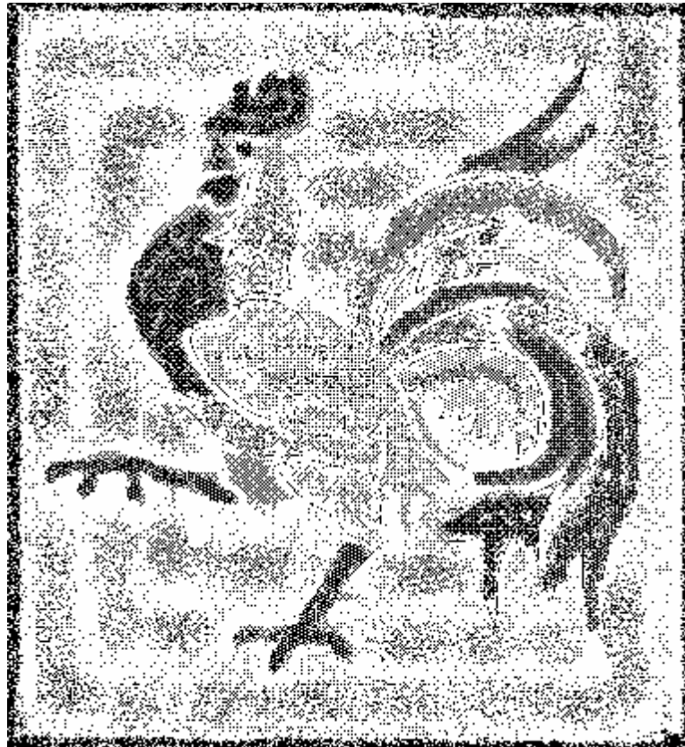
C(r)quis , par Niger